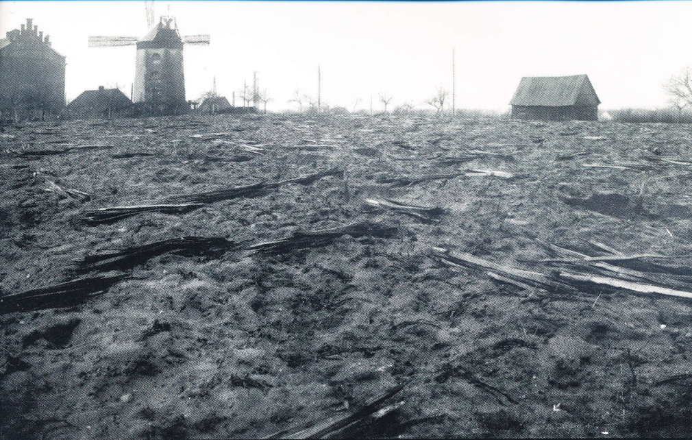
Lindenberg (Lipowe Wzgórze). Na zdjęciu uprawa po zlikwidowaniu plantacji. Została jedynie zaorana ziemia i drewniane kolki, na których zawieszano winorośl