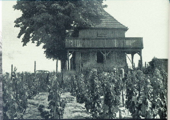
Schillerhöhe – jedna z winnic najczęściej prezentowanych na zdjęciach. Na jej szczycie stał charakterystyczny, drewniany dom winiarza z tarasami widokowymi