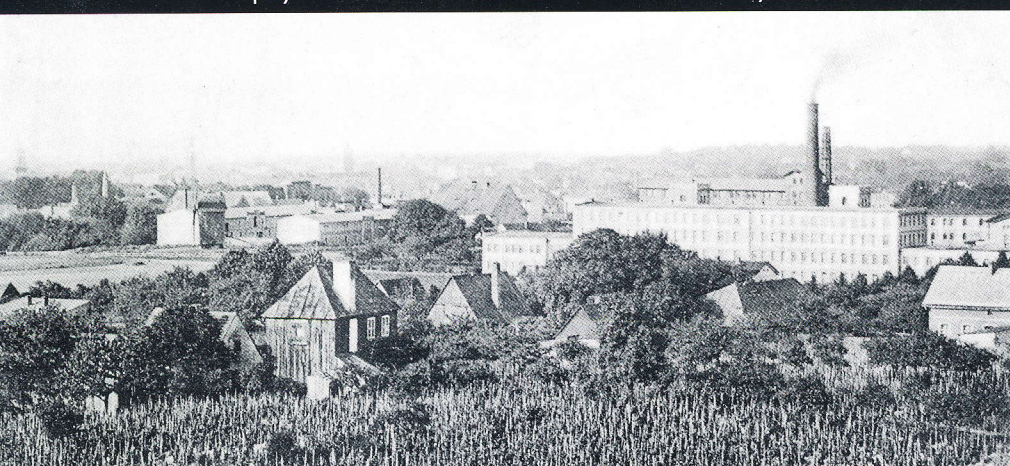
Panorama miasta ze Wzgórza Augusta – Augusthöhe, czyli dzisiejszej ulicy Kilińskiego. Na pierwszym planie winnice

Hohenberg – strome wzgórze usytuowane pomiędzy Freystadterstrasse (obecnie ulica Jędrzychowska) a Ochelhermsdorferstrasse (obecnie ulica Botaniczna). Rejon wymieniany w miejskich dokumentach już pod koniec XVII wieku. Jednak winnice znajdowały się tutaj już od XV wieku. Dzisiaj na tym obszarze mieści się osiedle Kościuszki.