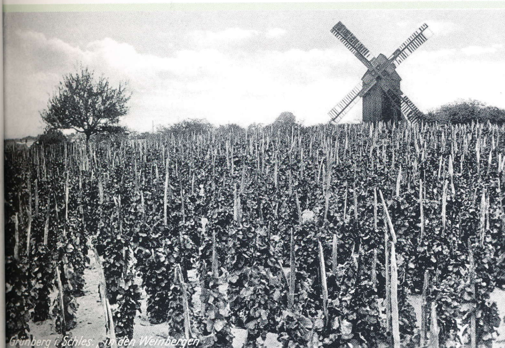
Grünberg i. Schles. - in den Weinbergen

Rodeland – rewir położony na południe od Wzgórza Löbtenz (obecnie ulica Słowackiego) i ulicy Lechitów. Nazwa pojawia się w dokumentach już w 1723