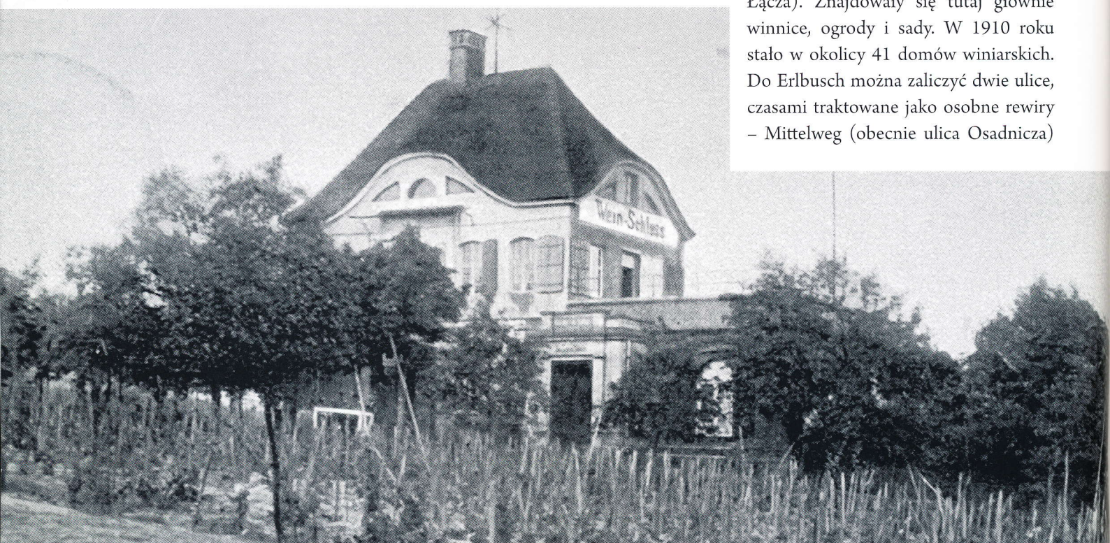
Ulica Piękna na Wzgórzach Braniborskich. W dawnym domku winiarza Kallenbacha przez wiele lat działała restauracja „Wein-Schlöss”

Erlbusch – rozległy teren na peryferiach miasta, wzdłuż potoku Luntze (Złota Łąca). Znajdowały się tutaj głównie winnice, ogrody i sady. W 1910 roku stało w okolicy 41 domów winiarskich. Do Erlbusch można zaliczyć dwie ulice, czasami traktowane jako osobne rewiry – Mittelweg (obecnie ulica Osadnicza)