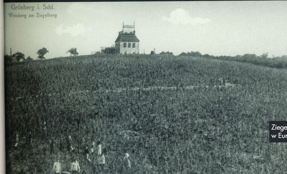
Grünberg i. Schl. Weinberg am Ziegelberg

W mieście stało kilkanaście drewnianych wiatraków. Na zdjęciu prawdopodobnie winnica w rewirze Maugschtberg