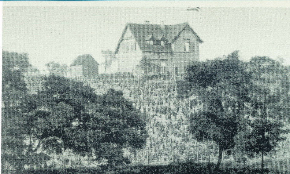
Winnice w południowej części miasta w rewirze Maugscht. Widoczna na zdjęciu willa nie przetrwała do dzisiaj