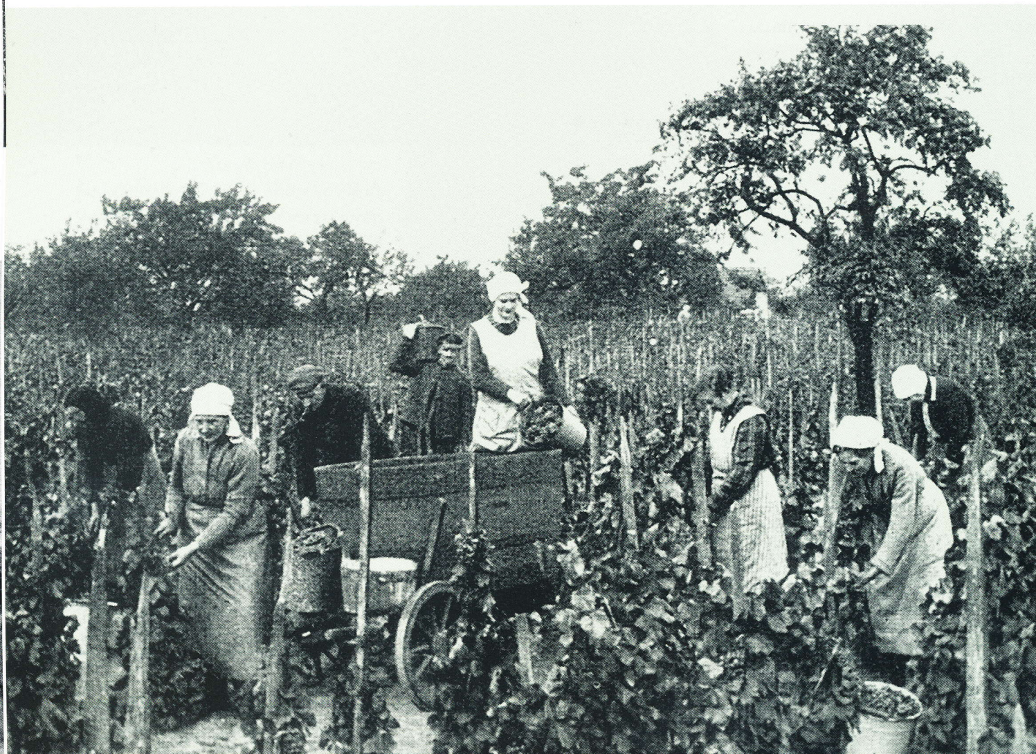
Nieznana winnica. Krzewy winorośli nie były rozciągane na drutach, lecz oplatały pojedyncze, drewniane kolki podporowe, lata 20. XX wieku

Zulichauer Chausse – rewir umiejscowiony wzdłuż trasy wylotowej z miasta (obecnie ulica Sulechowska) w kierunku Chynowa i Sulechowa. W 1910 roku stało tutaj siedem domów winiarskich.