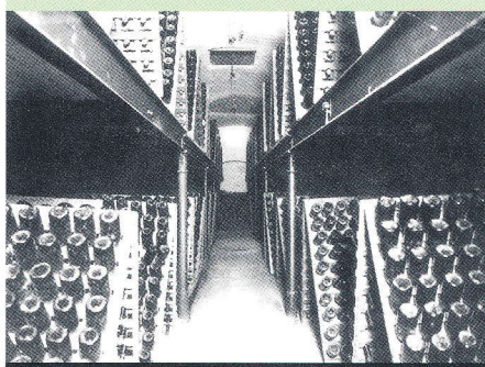
Piwnice Gremplera. Specjalne drewniane stojaki do przechowywania butelek z szampanem

Grempler produkcję swoich win musujących opierał na surowcu miejscowym i winie z Szampanii. Używano mieszaniny dojrzałego wina sprowadzonego z Francji, dojrzałego wina własnego i miejscowego wina młodego. Stosowano proporcje odpowiednio: 2:1:1. Tak wymieszane trunki rozlewano do grubościennych butelek i tymczasowo korkowano. Butelki trafiały do hal fermentacyjnych, gdzie ustawiano je w sztaplach. Po miesiącu przewożono je na trzy miesiące do piwnic, gdzie stały ustawione pod odpowiednim kątem. Każda butelka była dwa razy dziennie obracana o 3/4 obrotu. Zebrane przy korku osady zbierano poprzez mrożenie korka i jego usuwanie.